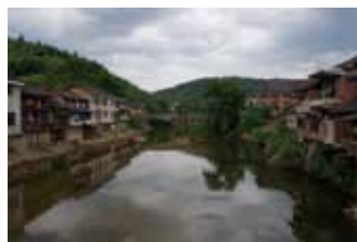
2011 年 3 月 - 5 月走访美丽浏阳河，拍摄者：卢七星、刘科

我们起初选择的方式是不断地告诉我们的朋友，告诉市民，告诉媒体这一条河（浏阳河）污染有多严重，这一条河流是多么的不堪，人们在唏嘘之后依旧不了解和不关注这条河流，网络上的关注也如同一阵风，浏阳河继续被污染。如果我们传递的是河流的美好呢？2011 年绿色潇湘开始关注到浏阳河的美丽。我们用“美丽的事物”建立起了城市的人们和河流之间的联系。人们会认为自己有责任保护身边的这样美丽的河流，同时谴责这条河的中下游出现的种种污染。