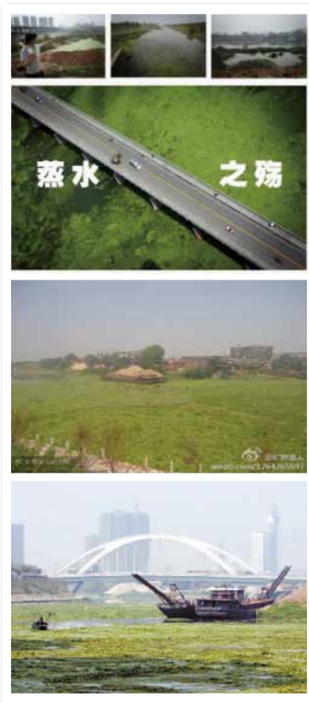
2011 年 10 月，蒸水段水葫芦爆发。