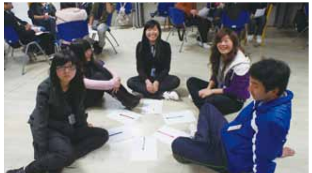
2011 年 4 月绿色青年能力提升学员分组讨论