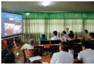
绿色潇湘“湘江守望者”志愿者队伍，也是湖南省环保志愿者分队。

2011年8月3日，绿色潇湘组织“守望母亲河”湘江流域民间观察和行动网络项目启动仪式，并对“湘江守望者”开展第一次监测和行动培训。