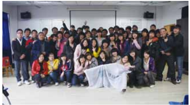
2011 年 4 月绿色青年能力提升计划学员合影

其二是“长沙市酒店宾馆及招待所‘七小件’提供情况”调查活动。活动由 3 名高校学员独立筹划并实施，通过组建志愿团队在长沙分区抽样调查，了解长沙酒店宾馆招待所有偿提供一次性日用品的现状，撰写调研报告，并通过行为艺术、绿色沙龙、向市长写信等方式将调查结果与公众分享，呼吁政府和市民重视并减少对宾馆酒店一次性日用品的消耗。