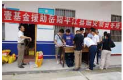
2011年7月救援物资发放现场

调研队伍每到一个地方，都通过水质监测、摄影摄像、问卷调查、访谈等形式开展调查。着重对湘江主干流各市断面，河流源头水、湘江主要一级支流交汇口、居民饮用水源、重点的排污口进行了水样采集，水质监测；通过一个月的实地调研，重点了解了湘江流域环境历史遗留问题、湘江流域干流和主要支流生态环境现状，并通过与媒体进行深度合作，倡导更多的人来关注身边的母亲河。