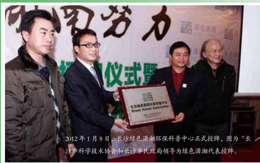
2012年1月8日，长沙绿色潇湘环保科普中心正式授牌，图为“长沙市科学技术协会和长沙市民政局领导为绿色潇湘代表授牌。