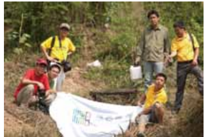
妙盛湘江行志愿者调研行动