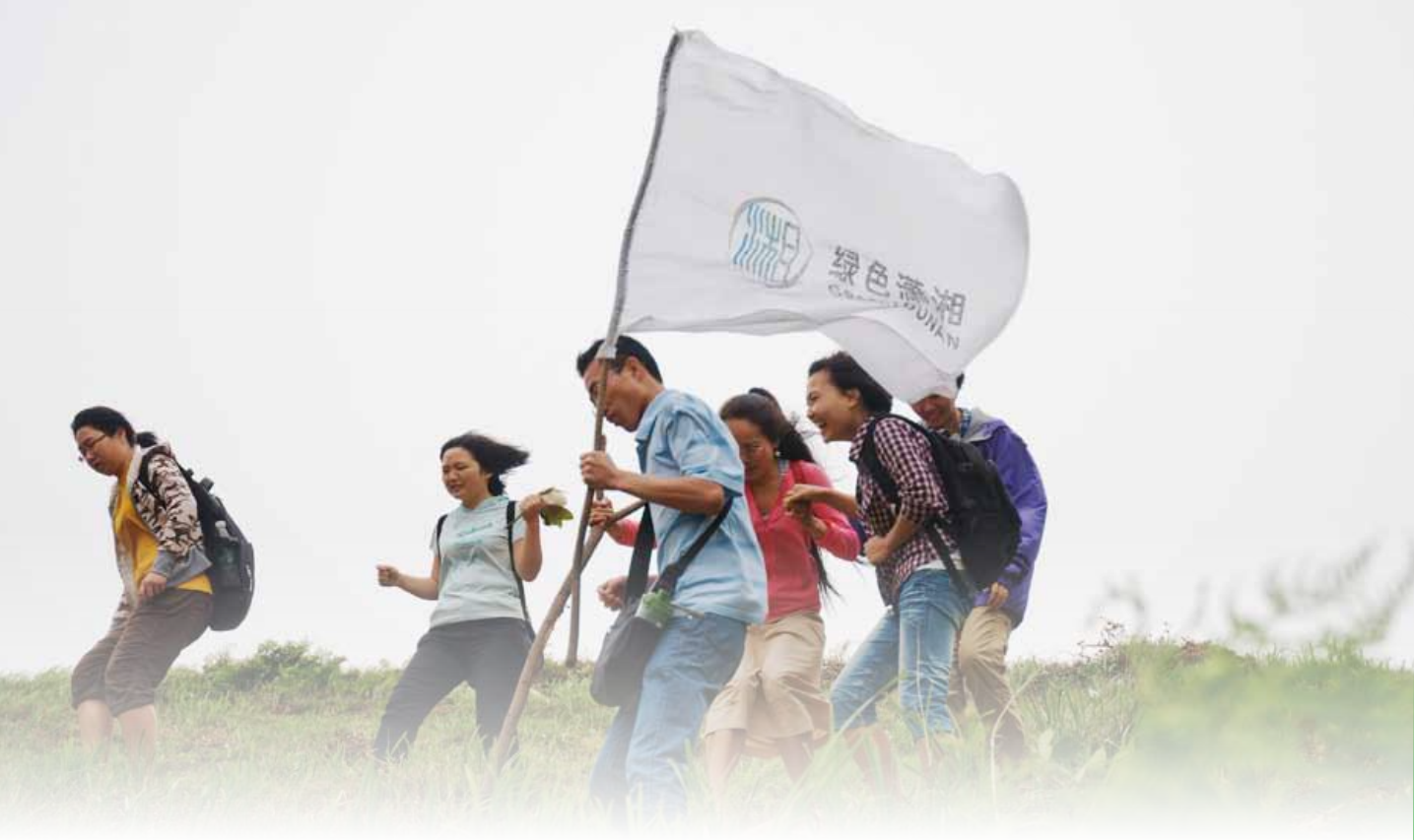
2011年5月11日，绿色潇湘组织市民开展圭塘河乐水行活动