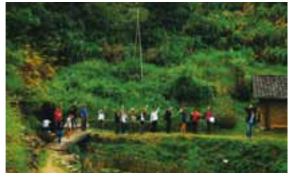
2011年9月“水会议”成员参加浏阳河乐水行