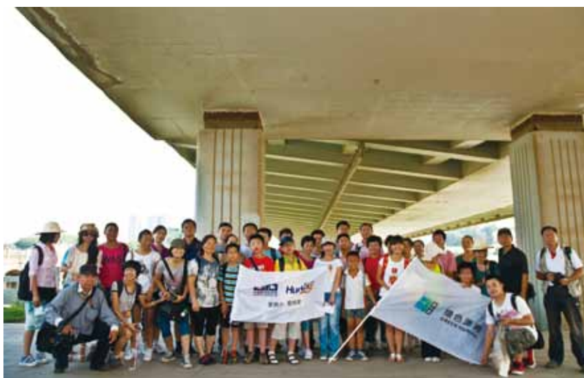
2011 年绿色潇湘全年城市乐水行剪影